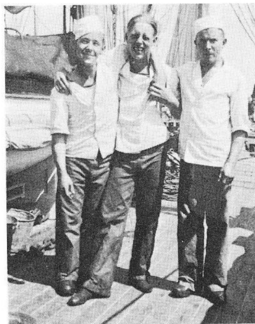
Två och en halv kock, absolut inte något att leka med

med och hade väl inte förstånd att se oss omkring på ett vettigt sätt. I Kolberg föstes en del av oss iväg till Burg Crössinsee, som var något så märkligt som en av Hitlers "riddarborgar" för utbildning av supermänniskor, SS-män. Mitt enda bestående intryck från denna anstalt var oerhört många, kolossalt blonda, kraftiga och självbelåtet leende ariska jättar. Och att skålar utväxlades för kung Gustaf och Hitler.