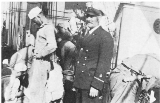
Uppbördskepparen, lugn, erfaren, ett stycke ovan allt det småskurna straffandet ochhetsandet

Men år 1938 levde pennalismen ännu, levde och frodades särskilt väl i segelfartygen.