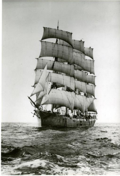
Fyrmastbarken Abraham Rydberg (1929-1942)