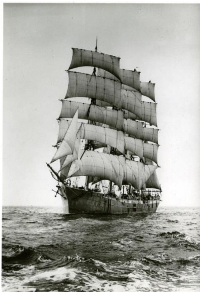
Fyrmastbarken Abraham Rydberg (1929-1942)