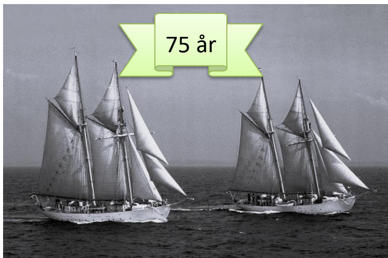
Skonerterna Gladan och Falken (1947- )