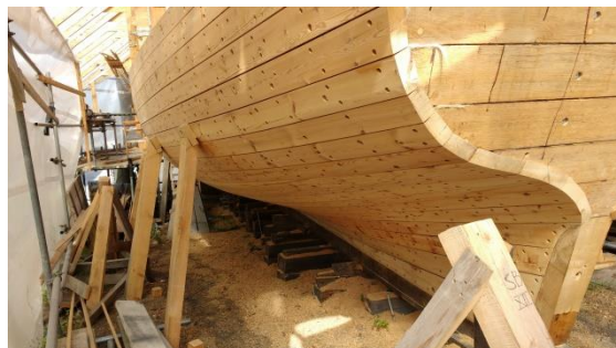
Förlig Wind i augusti 2018

Så här långt har skrovbygget kommit nu. Däcket är inte påbörjat ännu.