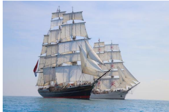
Stad-Amsterdam med systerfartyget Shabab Oman II i bakgrunden. Foto från drönare

lämna in en hälsodeklaration. Min hälsodeklaration accepterades och jag beslöt att segla med från Amsterdam via Porto i Portugal till Las Palmas Gran Canaria. En segling på ca tre veckor som paying crew.