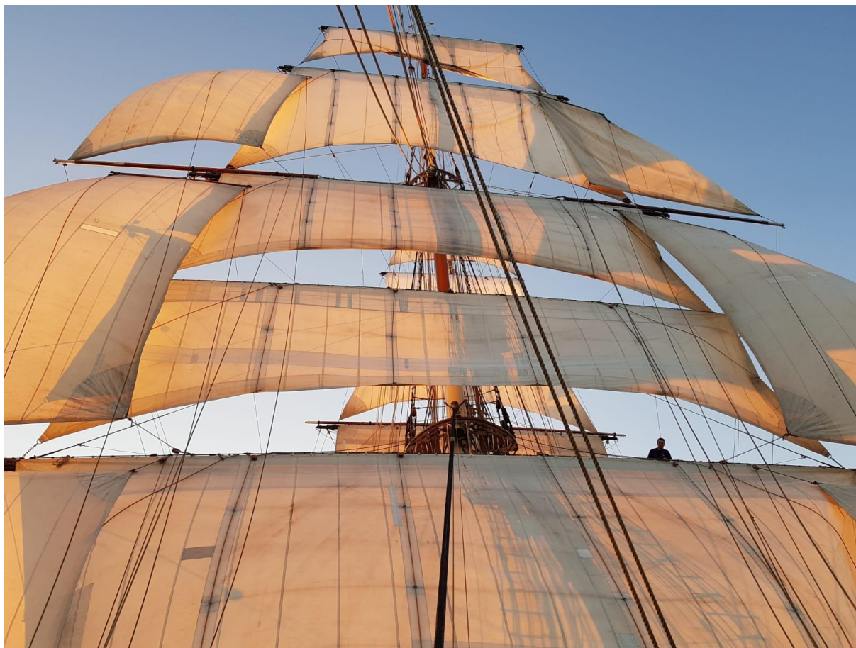
Klipperskeppet Stad Amsterdam. Förmasten med fullt ställ.