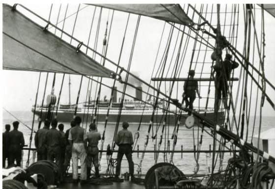
Den bredbente i mitten ska enligt den okände fotografen vara Björn Atterberg