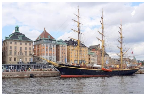
Georg Stage vid Skeppsbron.

Enligt togtplanen seglade man med Tall Ships Race mellan Esbjerg och Stavanger och går sedan in i Östersjön till Åland via Stockholm. Hon fortsätter sedan sydvart till Portugal och avslutar i Köpenhamn den 23 november.