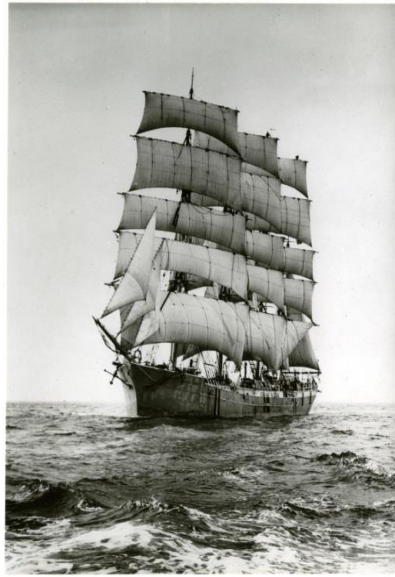
Fyrmastbarken Abraham Rydberg (1929-1942)