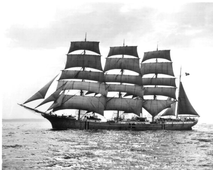
Fyrmastbarken Abraham Rydberg (1929-1942)