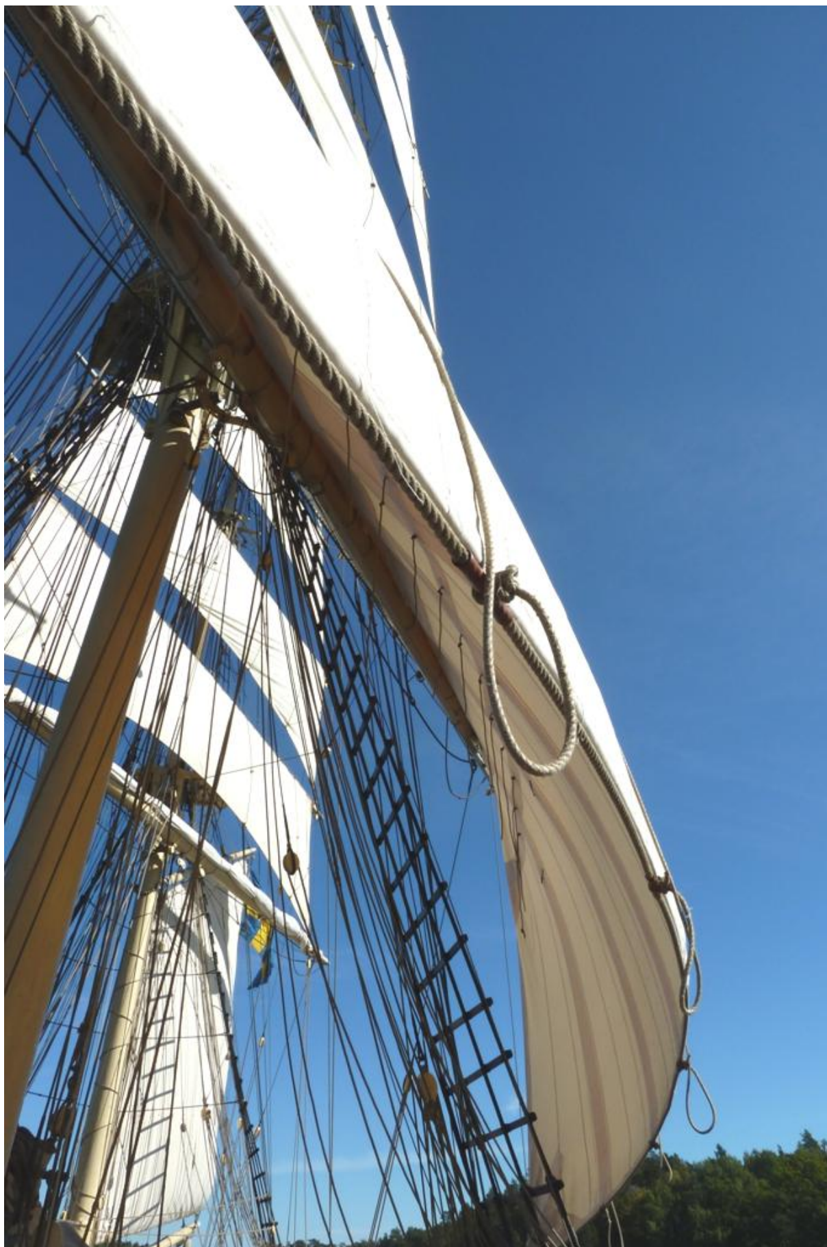
Några gånger rymde vinden litet