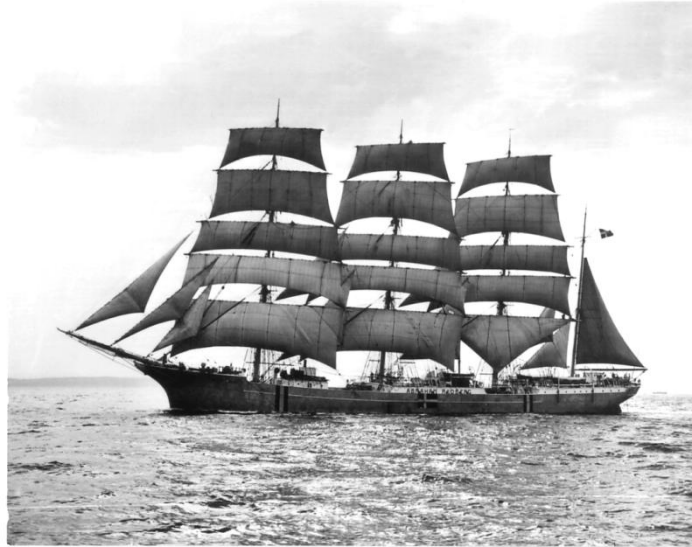
Fyrmastbarken Abraham Rydberg (1929-1942)